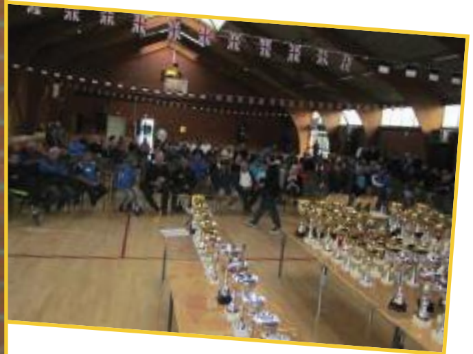
Il ne reste que 165 coupes à distribuer !!!