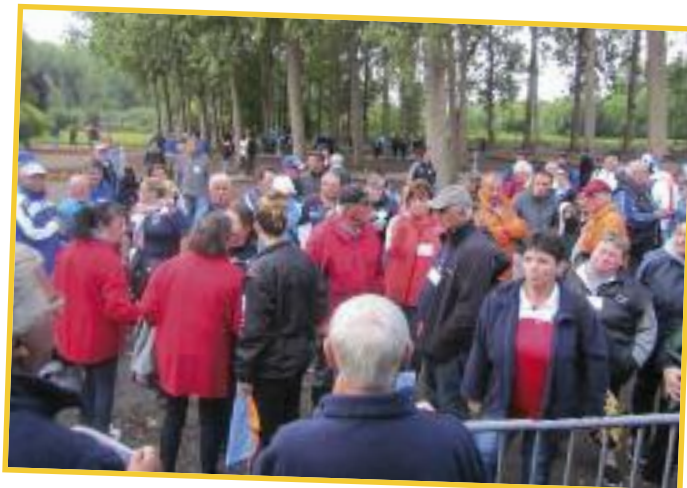
Qui joue contre qui ?