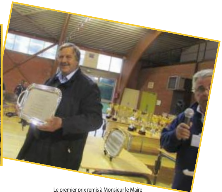
Le premier prix remis à Monsieur le Maire