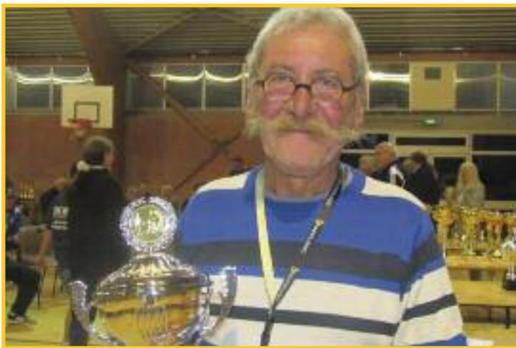
Un président heureux après des mois stressants