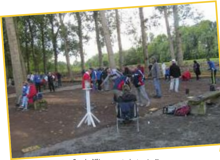
Que de différences entre les terrains !!!