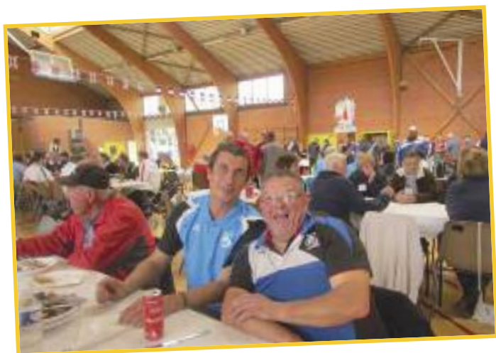
Un petit déjeuner à l'arrivée