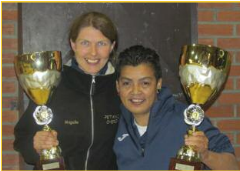
Super les filles !!!!