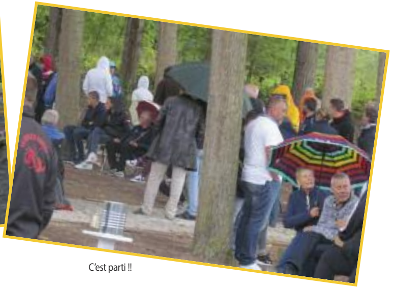
C'est parti !!

Oui, c'est notre particularité !! Nos 200 convives ont dégusté une carbonnade flamande préparée par notre traiteur local Quelques gouttes !! ouf !! juste un petit nuage !! Sous le soleil nos féminines en finale