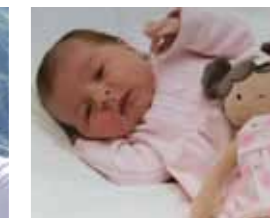
Le bébé de Mme Desprez