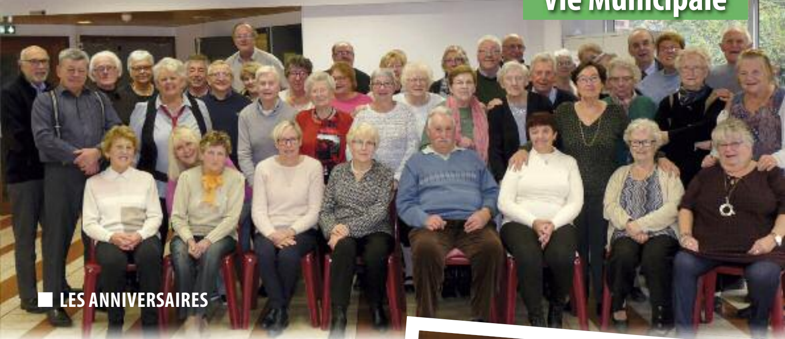
■ LES ANNIVERSAIRES