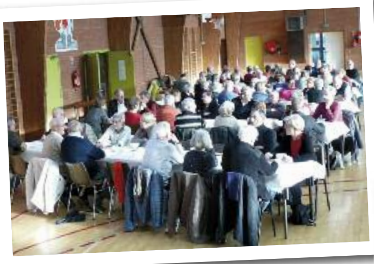
■ LE GOÛTER